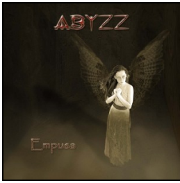
2010 Empusa (self-financed)